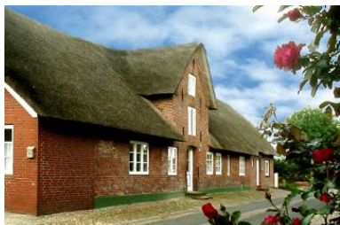
Das Haus "Welkimen tūs" in Oldsum Eingang zur Wohnung "Tradition"