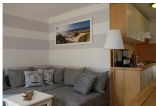
Die Couch, rechts im Bild die Küchenzeile