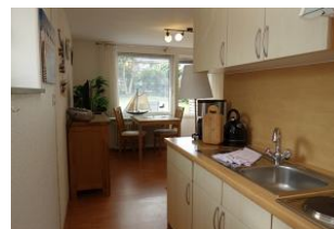
Die Küchenzeile vom Schlafzimmer aus Richtung Wohnzimmer.