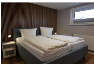
Das Schlafzimmer mit großem Doppelbett...