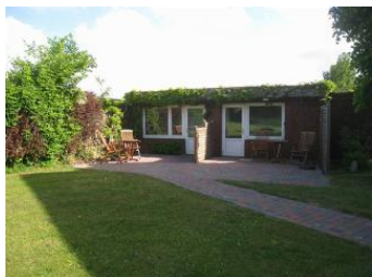
2 Bungalows bei Familie Carstensen, der rechte Eingang führt in die Wohnung 3