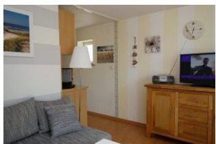
Der Durchgang führt zu Schlafzimmer und Bad