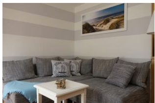
Kommen Sie herein und nehmen Sie Platz auf der gemütlichen Couch

Auf einem ca. 3000qm großen Grundstück zwischen Boldixumer Str. und Umgehungsstrasse können wir Ihnen 4 Ferienwohnungen für 2-5 Personen anbieten. Die Wohnung 3 - ein kleiner Bungalow mit ca. 33qm ist für zwei Personen eingerichtet. Wohnraum, offene Küchenzeile, Schlafzimmer und Duschbad, alles hat seinen Platz gefunden. Zudem eine herrliche Terrasse auf der Sie in der Morgensonne frühstücken können.