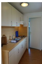
Die offene Küchenzeile, die Tür führt ins Schlafzimmer