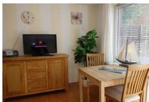
Der Esstisch mit Blick in den Garten. Das TV Gerät