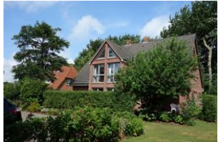
Haus Neshörn in Wyk im Sommer

Das Haus Neshörn ist zu erreichen über die Strasse "Am Leuchtturm" Hausno.4 liegt gemeinschaftlich mit der "Strandvilla" auf einem großen Grundstück der Familie Buchner/Petersen. Wir bieten Ihnen mit der Whg.2 (Atlantis) im EG eine große Wohnung für den Familienurlaub. Die unmittelbare Lage zum Strand und der damit verbundenen salzigen Seeluft macht hungrig und müde. Da ist es schon sehr erholsam, wenn man nur ein paar Schritte nach Haus gehen muss.