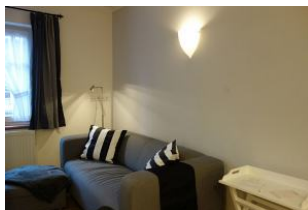
Hier noch einmal die Couch