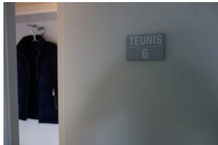
Die Wohnung 6 befindet sich im 2.OG links