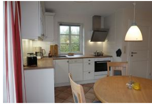
...hier noch einmal