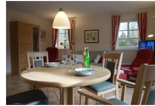
...nehmen Sie Platz ! Guten Appetit.