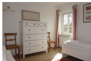
Kommode im Kinderzimmer