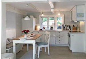
Esstisch und Küche