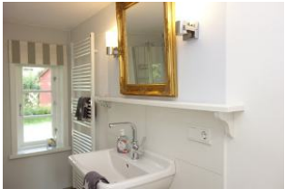
Das Bad im EG mit Handwaschbecken ...