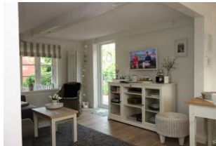
Blick ins Wohn-/Esszimmer