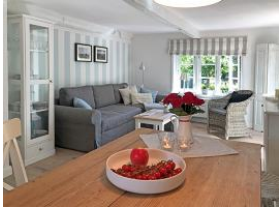
Der Blick vom Küchen-/Essbereich in den Wohnbereich