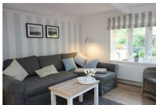
...die bequeme Couch...