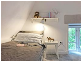
...zusätzlich ein Einzelbett Nicht im Bild, das TV Gerät