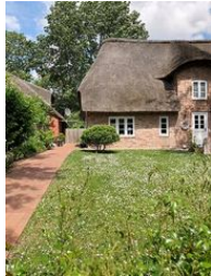
Die linke Hälfte des Hauses Buurnstrat 40 - WattLütt

Die Unterkunft verteilt sich über EG und 1.OG.