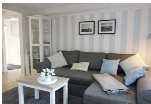
...von der anderen Seite.