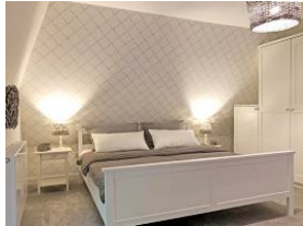
Das Schlafzimmer im Obergeschoß mit großem Doppelbett 180x200cm