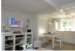
...und umgekehrt, im Hintergrund die Küche