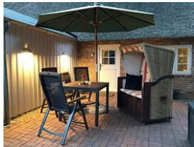
Die Terrasse mit bequemen Stühlen und Strandkorb