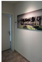
...treten Sie ein, die Wohnung "Atlantis" erwartet Sie..