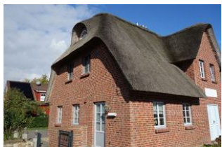
Der linke Eingang führt in das Haus 2

Im idyllischen Dorf Oevenum finden Sie das Doppelhaus "Golfoase" Zwei großzügige Doppelhaushälften für jeweils 6 Personen erwarten Sie. Ein gemütliches Wohnzimmer mit offener Küche und familientauglichem Essplatz. Austritt in den Garten und zur möblierten Terrasse. Ein großes Duschbad mit Waschmaschine und Trockner. Im Obergeschoß die Schlafräume und ein weiteres Bad mit Dusche und Badewanne. Hier ist an alles gedacht, hier kann man sich wohlfühlen, hier wird es Ihnen einfach nur gut gehen, und das Beste....hier darf auch Ihr Vierbeiner dabei sein.