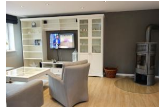
Herrlich ....ein Ofen. Holz gibts im REWE-Markt