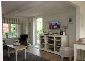
Blick ins Wohn-/Esszimmer