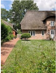
Die linke Hälfte des Hauses Buurnstrat 40 - WattLütt

Die Unterkunft verteilt sich über EG und 1.OG.