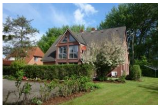
Das Haus Neshörn, Am Leuchtturm 4 in Wyk

Das Haus Neshörn ist zu erreichen über die Straße "Am Leuchtturm" Hausno. 4 liegt gemeinschaftlich mit der "Strandvilla" auf einem großen Grundstück der Familie Buchner/Petersen. Die Whg. 1 (Rungholt) befindet sich im EG mit herrlicher Süd - Terrasse. Der große Wohnraum mit offener Küchenzeile, das Schlafzimmer mit großem Doppelbett, das moderne Duschbad und nicht zuletzt die Nähe zum Strand, lassen das richtige Urlaubsfeeling aufkommen.