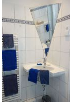
Das Waschbecker mit spezieller Spiegellösung