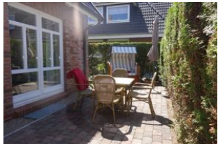
Der herrliche Terrassenplatz