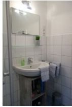
...mit Handwaschbecken und genügend Ablagefläche