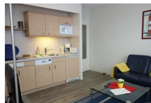
Hier noch einmal die Küchenzeile