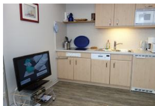
Die offene Küchenzeile