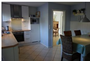
Die große Wohnküche mit...