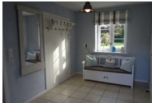
Der geräumige Flur. Genügend Platz für alle Jacken und Schuhe.