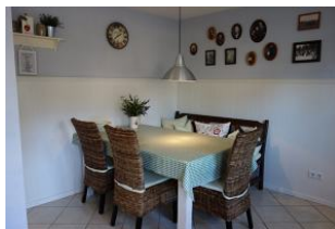
...herrlichem Essplatz in der Küche, so gemütlich !