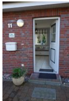
...Treten Sie ein ...