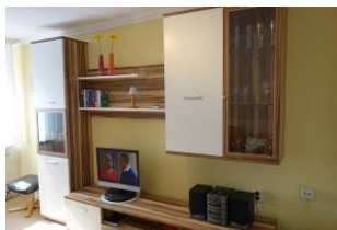
Stereolanlage und Flachbild-TV dürfen nicht fehlen.