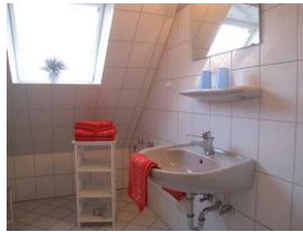
Das Badezimmer mit ...