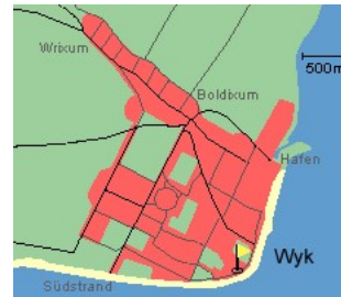
Entfernungen, zirka: zum Bäcker 700 m, zur Einkaufsmöglichkeit 900 m, zum Flugplatz 2,7 km, zum Golfplatz 2,8 km, zum Hafen 1,8 km, zum Meer 50 m, zum ÖPNV 400 m, zum Badstrand 50 m, zum Ortszentrum 1,0 km