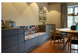
eine zusätzliche Sitzbank am Esstisch