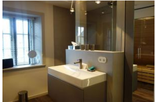
Das Bad im Obergeschoss. Hinter der Glaswand befindet sich .....