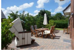
Die herrlich eingewachsene Terrasse. Die Terrassentür befindet sich am Essplatz.