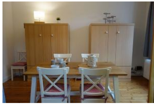
...hier die beiden Schrankbetten von denen jede Matratze 110cm in der Breite misst. Tisch beiseite geschoben und fertig ist das zweite Schlafzimmer.