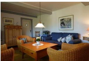
Eine Couch, drei Sessel - gemütlicher gehts kaum