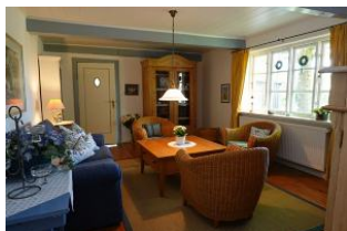
Das gemütliche Wohnzimmer