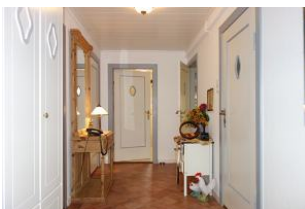
...treten Sie ein...