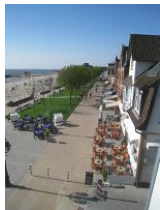
Der Blick auf den neu gestalteten Sandwall

In diesem, fast 100 Jahre alten Stadthaus wohnt man wirklich "mittendrin". Auf der geschlossenen Veranda, die Wind und Wetter abhält, den Blick auf die Promenade aber freigibt, könnte man den ganzen Tag verbringen. Den Menschen zusehen, entfernt die "Kurmusik" hören, aufs Meer schauen - eben einfach die Seele baumeln lassen. Das ist Erholung pur. Die modern eingerichtete Wohnung mit dem Charme alter Gemäuer liegt im 2.OG des Hauses und bietet 2 Personen ausreichend Platz für einen erholsamen Urlaub. Aber Achtung: dies alte Haus hat auch alte Treppen. Lang, steil und kurze Stufen. Allein vom Hauseingang in die 1.Etage müssen Sie 17 Stufen bewältigen.