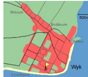
Entfernungen, zirka: zum Bäcker 100 m, zur Einkaufsmöglichkeit 150 m, zum Flugplatz 2,5 km, zum Golfplatz 2,6 km, zum Hafen 2,0 km, zum Meer 250 m, zum ÖPNV 250 m, zum Badestrand 250 m, zum Ortszentrum 1,5 km