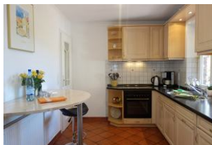
Die separate Küche ...