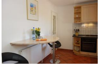
...mit kleinem Essplatz