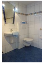
Handwaschbecken und Toilette, sowie...