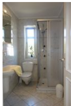
Das Duschbad im Erdgeschoß