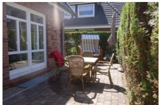
Der herrliche Terrassenplatz

Entfernungen, zirka: zum Bäcker 150 m, zur Einkaufsmöglichkeit 150 m, zum Flugplatz 3,0 km, zum Golfplatz 3,0 km, zum Hafen 2,0 km, zum Meer 200 m, zum ÖPNV 70 m, zum Badestrand 200 m, zum Ortszentrum 120 m