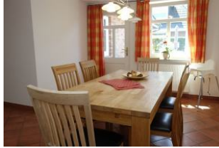
...und Austritt auf die Terrasse, die mit Tisch und Stühlen sowie einem Strandkorb auf Sie wartet.