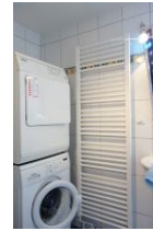
...Waschmaschine und Trockner - kostenfrei zu nutzen