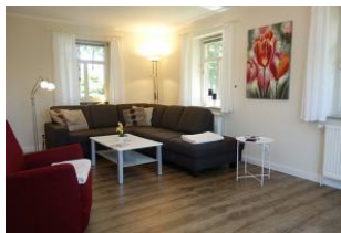
Die Wohnlandschaft - herrlich zum relaxen...