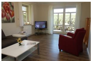
Gemütlicher Sessel, großes TV Gerät mit DVD Player ....