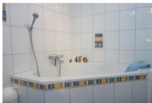
Das Wannenbad ebenfalls im Erdgeschoß mit...