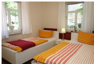
Im Erdgeschoß das Schlafzimmer mit zwei Einzelbetten und ...