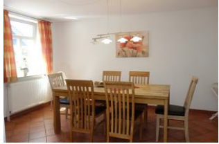
Das Esszimmer - Platz für Alle