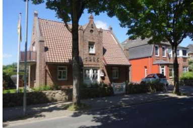
Das Haus Badestrasse 30a in Wyk

Die Unterkunft verteilt sich über EG und UG.