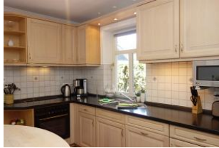
Hier noch einmal die Küchenzeile