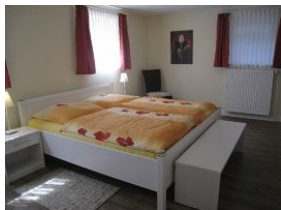
Ein großes Schlafzimmer im UG