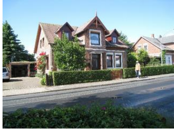
Das Haus Boldixumer Str. 25 in Wyk