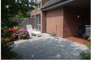
Für das Sonnenbad ein große Terrasse...