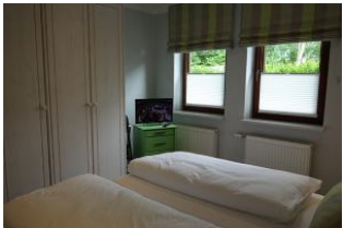
...großem Kleiderschrank und TV-Gerät