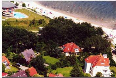
Die Unterkunft befindet sich im EG.