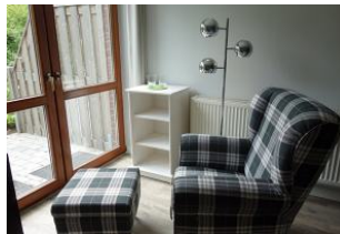
...mit Blick aus dem Fenster oder für eine Lesestunde ?