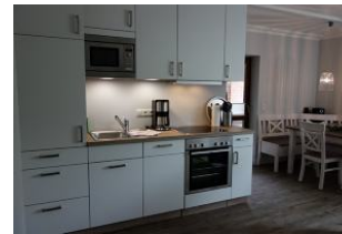
Die offene Küchenzeile, im Hintergrund der Essplatz