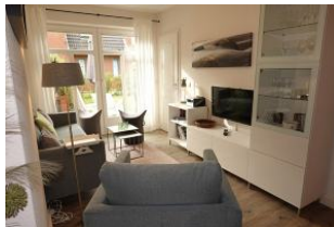
...der gemütliche Wohnbereich...