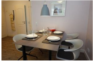
...noch einmal der gedeckte Tisch, im Hintergrund die Türen ins Kinderschlafzimmer und ins Bad.