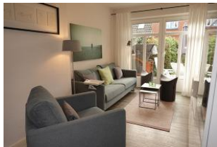
... noch einmal der Wohnbereich