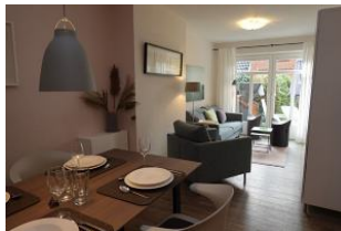
Der Essbereich und Blick in den Wohnbereich.