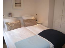
Hier noch einmal die Betten, je 90x200m