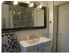
Im Duschbad ein großer Spiegel...