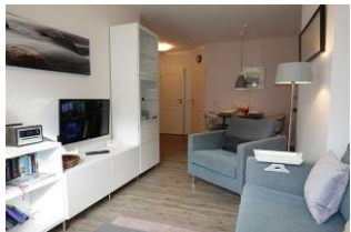
Der Wohnbereich mit Blick zum Esstisch.