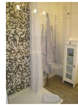
Die Dusche mit Echtglaswand, an der kurzen Seite mit Duschvorhang