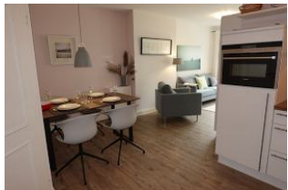
...kommen Sie herein.....

Zauberhafte Wohnung im Erdgeschoss. Klein aber fein ! Diese Wohnung hat alles, was man benötigt für einen Familienurlaub. Zwei Schlafzimmer mit bequemen Einzelbetten (Hotelbetten), die zusammen oder auseinander gestellt werden können, ein gemütliches Wohnzimmer mit Austritt auf die Terrasse. Offene Küchenzeile, großer Essplatz, Duschbad. Super Lage zum Strand (ca. 300m)...und das Tollste: im Nachbarhaus auf gleichem Grundstück befinden sich ein kleines Schwimmbad und Fitnessraum (kostenfrei zu nutzen) sowie eine Sauna - zur Nutzung derselben bekommen Sie bei uns im Büro passende Münzen.