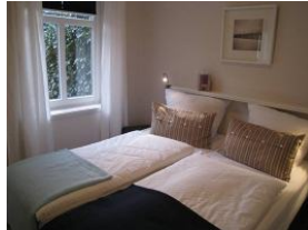
Das zweite Schlafzimmer mit Fenster zum Garten.