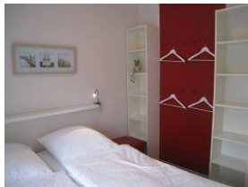
Weisse Regale, rote Paneelwand - farbenfrohes Schlafzimmer für die Kinder.