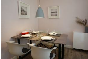
Der gedeckte Tisch...