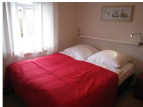
Ein Schlafzimmer, mit Fenster zum Parkplatz. 2 Betten a 90x200m