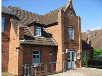
Die Aussenansicht des Hauses Badestr. 40