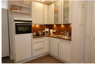
...wer kocht heute ?