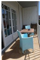
Der Balkon mit Tisch + 2 gemütlichen Sesseln. Zudem steht ein Hochlehner (Rückenlehne verstellbar) und Holzstühle zur Verfügung.