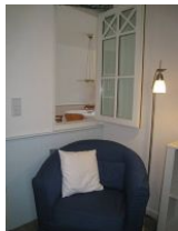
Das offene Fenster zum Wohnzimmer garantiert die Belüftung des Zimmers. Klingt komisch, klappt aber....