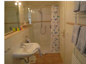
... einer herrlich großen Duschkabine.