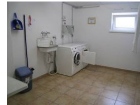
Waschmaschine und Trockner gegen Gebühr im Keller des Hauses