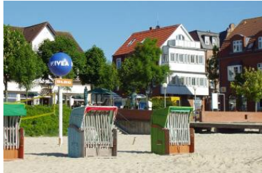
Das Haus Mittelstr.2/Ecke Sandwall