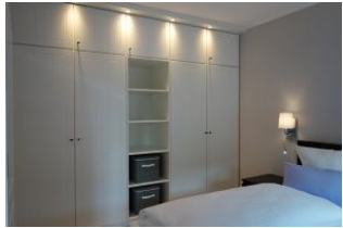
Genügend Schrankraum !