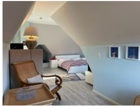
...das Dachzimmer, herrlich gemütlich: