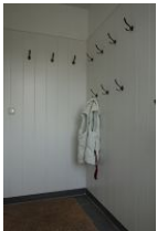
Vorflur und Garderobe zur Whg. 10

...wer ist eigentlich "Paul" ? Unsere Häuser Paul und Paula stehen dort, wo einmal die Pension "Vier Jahreszeiten" stand. Eine großzügige Wohnung über zwei Etagen und mit allem Komfort erwartet Sie im Haus Paul. Man spürt, hier wurde jedes Möbelstück einzeln ausgesucht. Mit viel Liebe zum Detail entstand hier eine Farbharmonie, wie man sie selten findet. Gemütliche Sitzmöbel wie die Couch mit verstellbaren Rückenlehnen, ein Pöng von IKEA, wie wir ihn alle kennen, bequeme Stühle am Esstisch, und, und, und. Sehen Sie selbst und fühlen Sie sich wohl, wir haben unser Bestes gegeben. Perfekt auch für Golfer. Die Entfernung zum Golfplatz beträgt nur 2,6 km