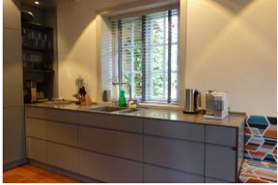
Ein Teil der Küche, hier die Spüle