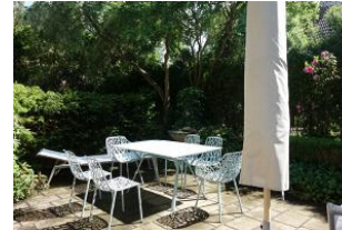
...herrlich eingewachsene Terrasse, Tisch und Stühle, 2 Liegen.