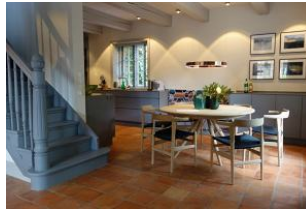
Der Essplatz mit Blick zur TV - Sitzzecke oder zur Küche