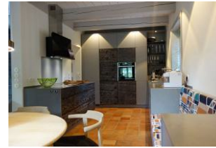
Die offene, hochmoderne Küche...