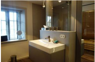
Das Bad im Obergeschoss. Hinter der Glaswand befindet sich .....