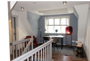
Der Flur im OG mit Schreibtisch für kreative Gedanken.