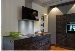
Das Vollinduktionsbedienfeld, hier kocht es sich fast wie von allein