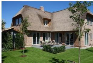
Die herrliche Terrasse. Hier dürfen Sie den Tag beginnen.....