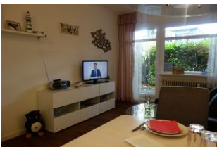
Der Blick zur Terrasse