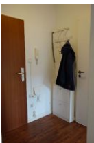
Der kleine Flur mit Garderobe und Schuhschrank