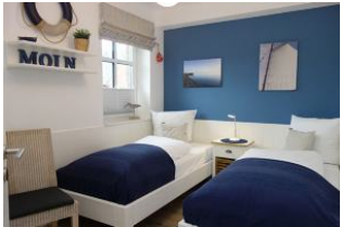
Das Kinderschlafzimmer mit 2 Einzelbetten