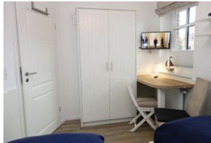
Schrank und TV Gerät