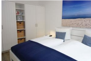
...genügend Schrankraum, nicht im Bild, das TV Gerät