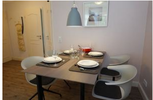
...noch einmal der gedeckte Tisch, im Hintergrund die Türen ins Kinderschlafzimmer und ins Bad.