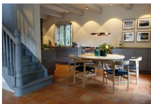
Der Essplatz mit Blick zur TV - Sitzzecke oder zur Küche