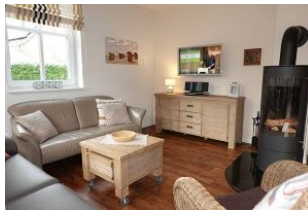
Das TV Gerät und Ofen