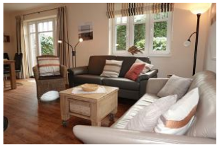
Zwei Sofas garantieren einen gemütlichen Abend

Dieses Einzelhaus in der Flurstrasse in Wyk, läßt Urlaubsherzen höher schlagen. Herrlich für Familien. Vier Schlafzimmer geben jedem Familienmitglied eine Rückzugsmöglichkeit. Der gemeinsame Wohn- Essraum mit halb offener Küche dient der Kommunikation. Zwei Bäder lassen auch am Morgen nicht das Frühstück in unendliche Ferne rücken. Das Fensteröffnen zum lüften ist nicht nötig, das Haus verfügt über eine zentrale Lüftungsanlage, die einen hohen Komfort der Raumluft garantiert. Hier wurde an Alles gedacht, seien Sie gespannt. Ach übrigens, sind Sie vielleicht Schachspieler ? Im Garten befindet sich ein 4x4 m großes Schachfeld aus Steinplatten, den Schlüssel zum Schrank für die großen Figuren bekommen Sie bei uns !