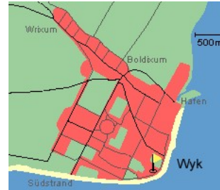
Entfernungen, zirka: zum Bäcker 400 m, zur Einkaufsmöglichkeit 1,0 km, zum Flugplatz 2,7 km, zum Golfplatz 2,7 km, zum Hafen 1,7 km, zum Meer 50 m, zum Badestrand 50 m, zum Ortszentrum 1,0 km