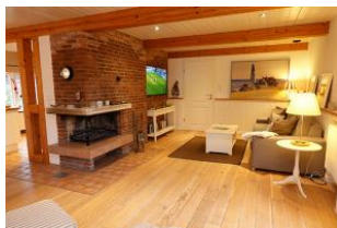
...für den Fernsehabend....