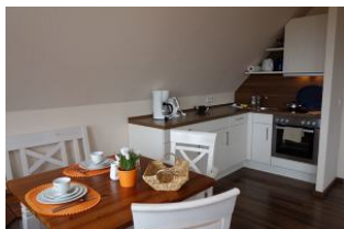
Die offene Küchenzeile mit Essplatz