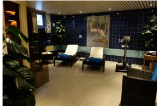
Der Fitnessbereich im Untergeschoß mit...