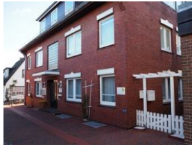
Ansicht Haus Teunis Mühlenstr.