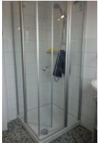
...und flacher Duschkabine.