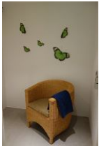
...und gemütlichem Sessel zum ausruhen.