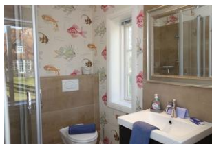
Das Duschbad im Erdgeschoß