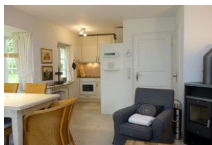
Blick zur Küche