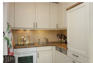
Die offene Küche