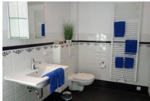
Das Bad im Erdgeschoß...