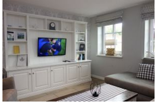
Im Wohnzimmer ein großes TV Gerät