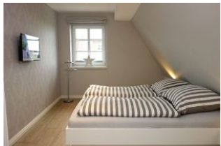
Das Elternschlafzimmer mit TV...