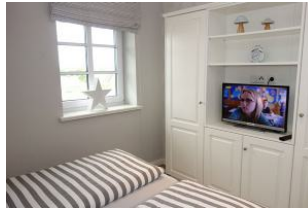
...Schrankraum und TV Gerät