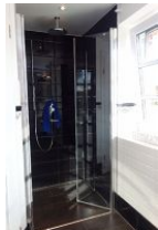
...die bodengleiche Duschkabine