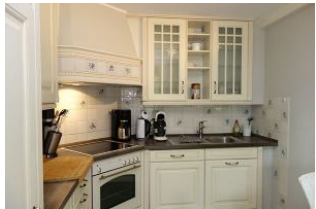
Die offene Küche