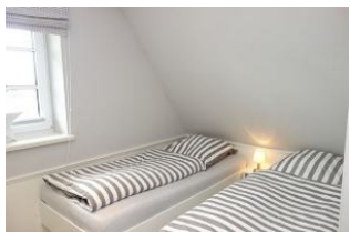
Das Kinderzimmer mit 2 Einzelbetten...