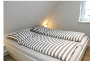
Das dritte Schlafzimmer mit Doppelbett und ...