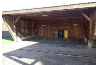
Carport für beide Haushalten, zusätzlich ein weiterer Parkplatz zur Verfügung.