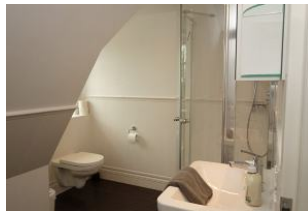
Das Bad im Obergeschoß...