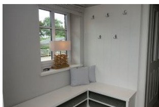
Der Eingangsbereich, Platz für Outdoorkleidung und Schuhe

Im idyllischen Ort Oevenum finden Sie das Doppelhaus Golfoase. Zwei großzügige Doppelhaushälften für je 6 Personen erwarten Sie. Ein gemütliches Wohnzimmer mit offener Küche und familientauglichem Essplatz, Austritt in den Garten und zur möblierten Terrasse, Sauna (mit Zusatzkostenverbunden). Ein großes Badezimmer mit Waschmaschine und Trockner. Im Obergeschoß die Schlafräume und ein weiteres Dusch+Wannenbad. Hier ist an alles gedacht, hier kann man sich wohlfühlen, hier... wird es Ihnen einfach nur gut gehen und das Beste.....Ihr Vierbeiner darf auch dabei sein.