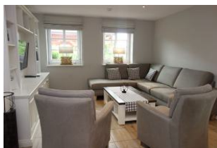
Die Sitzecke...für jeden ein gemütliches Plätzchen