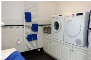
... mit Waschmaschine+Trockner zur kostenfreien Nutzung.