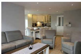
Die Sitzecke mit Blick zur Küche