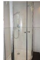
...mit Duschkabine und ...