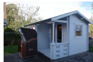
Das Saunahaus (Nutzung gegen Gebühr)