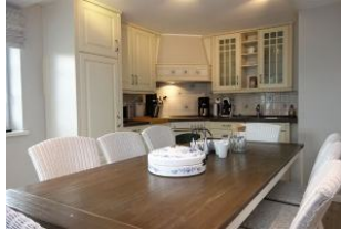
Der große Esstisch, im Hintergrund die Küche