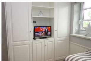
...Einbauschränk und TV Gerät.