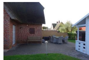
Die Terrasse im Herbstschlaf, rechts im Bild das Saunahaus