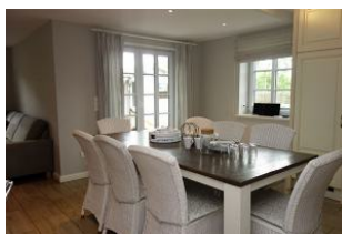
Dieser Esstisch bietet allen Familienmitgliedern einen Platz.