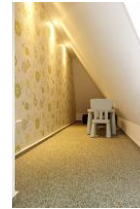
...die geheimnisvolle Kinderspielecke....