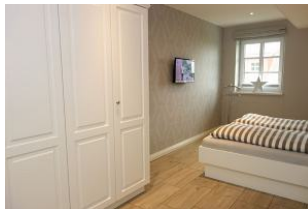
...und viel Stauraum für Kofferinhalte.