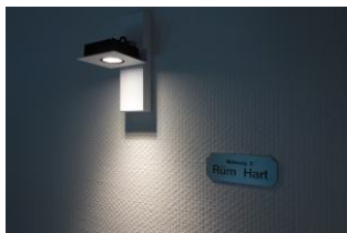
Die Wohnung 3 - Rüm Hart lädt ein .....