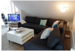
...hier finden alle Familienmitglieder ein Plätzchen