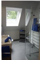
Das moderne Duschbad... (nicht im Bild: die Toilette)