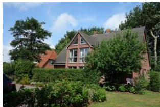
Haus Neshörn in Wyk im Sommer Die Unterkunft befindet sich im 1.OG

Das Haus Neshörn ist zu erreichen über die Straße "Am Leuchtturm" Hausno. 4 liegt gemeinschaftlich mit der "Strandvilla" auf einem großen Grundstück der Familien Buchner/Petersen. Die Whg. 3 (Rüm Hart) befindet sich im 1. und 2. OG des Hauses und hat ausreichend Platz für 4 Personen. Großer Wohn/Essraum mit offener Küche im 1.OG sowie ein Doppelschlafzimmer und das Duschbad. Im 2.OG befindet sich das zweite Schlafzimmer mit großem Doppelbett und einem weiteren Bad mit WC und Handwaschbecken. Der Clou: ein herrlichen Balkon, der Ihnen die Nachmittags- und Abendsonne beschert.