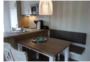
.Der Esstisch - Anschluss.....