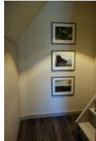
...hier finden Sie Schränke für Ihre Kofferinhalte und hier geht's hinauf ins Dach in die gemütliche Leseecke