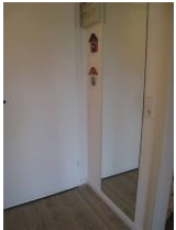
Der Eingangsbereich mit großem Spiegel.