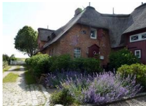
Der Hahnenhof. Der Eingang zur Wohnung 6 befindet sich links am Haus, kurz vor dem weißen Tor.

Großes eingewachsenes Areal mit insgesamt 6 Ferienwohnungen. Wir bieten Ihnen hier die Wohnung 6 für 4 Personen an. Im Erdgeschoß der große Wohnraum mit Kamin und Essplatz. Austritt zur Terrasse und dem Garten. Sep. Küche, ebenfalls mit Essplatz. Duschbad. Im Obergeschoß zwei Doppelschlafzimmer und ein kleines Duschbad. Das Haus wurde in den letzten 2 Jahren renoviert, neu möbliert und mit viel Liebe zum Detail für Sie eingerichtet und dekoriert. Keine Teppichböden mehr. Wer Ruhe sucht, lange Spaziergänge durch die Marsch liebt, wohnt hier genau richtig.