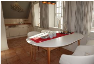
...hier noch einmal der Esstisch.